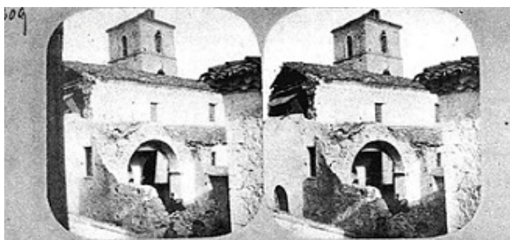
Veduta della SS. Trinità, da sud-ovest, subito dopo il terremoto del 1857

L'edificio medievale era di stile romanico, a tre navate, con copertura a capriate. Il presbiterio presentava tre absidi e lungo le navate laterali si aprivano arcate con relative cappelle. Tali notizie si desumono dai verbali delle visite pastorali del Vescovo potentino Tiberio Carafa del 1566 e 1571 e da una fotografia di Robert Mallet scattata ai resti della chiesa poco dopo il sisma del 1857.