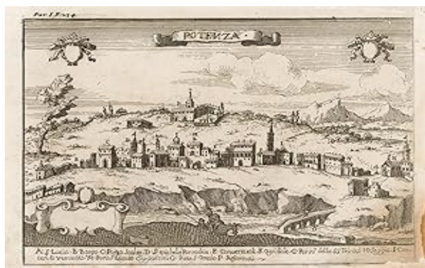
(G.B. Pacichelli, Veduta della città di Potenza , 1703)

L'edificio medievale era di stile romanico, a tre navate, con copertura a capriate. Il presbiterio presentava tre absidi e lungo le navate laterali si aprivano arcate con relative cappelle. Tali notizie si desumono dai verbali delle visite pastorali del Vescovo potentino Tiberio Carafa del 1566 e 1571 e da una fotografia di Robert Mallet scattata ai resti della chiesa poco dopo il sisma del 1857.