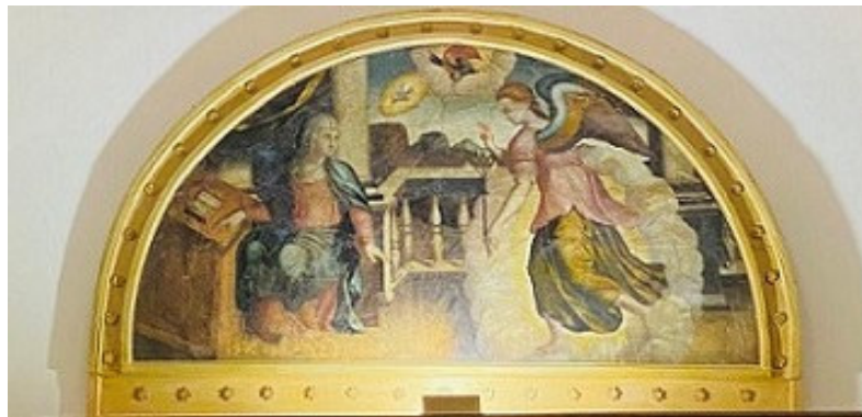
(Antonio Stabile, attr. Annunciazione , sec. XVI)