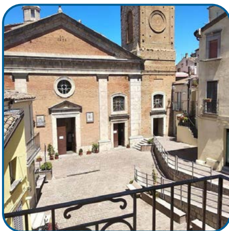
Beata Vergine Maria del Carmine Avigliano (PZ)