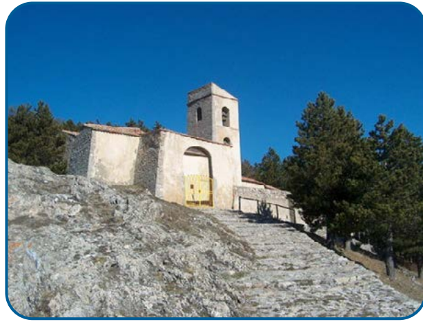
Madonna di Monteforte Abriola (PZ)

Il luogo di culto dedicato alla Madonna di Monteforte è collocato in posizione panoramica sulla sommità di un monte. Di origine medievale, preserva un affresco raffigurante una Madonna sul trono, databile tra il 1250 ed il 1350. È invece di epoca successiva, probabilmente del XV secolo, la statua lignea della Madonna con Bambino, che viene processionalmente tralata, accompagnata dai fedeli e pellegrini, nella Chiesa Madre di Abriola nella Festa della Assunzione della Beata Vergine Maria, per ritornare sul monte la prima domenica di giugno. Il 31 maggio 2017 mons. Salvatore Ligorio arcivescovo metropolita di Potenza-Muro Lucano-Marsico Nuovo ha conferito il titolo di Santuario Diocesano «al Tempio che, eretto nel contesto della parrocchia “Santa Maria Maggiore” di Abriola e che custodisce la venerata immagine della Madonna di Monteforte» per promuovere ed attestare il culto mariano presente “ ab immemorabili ”.