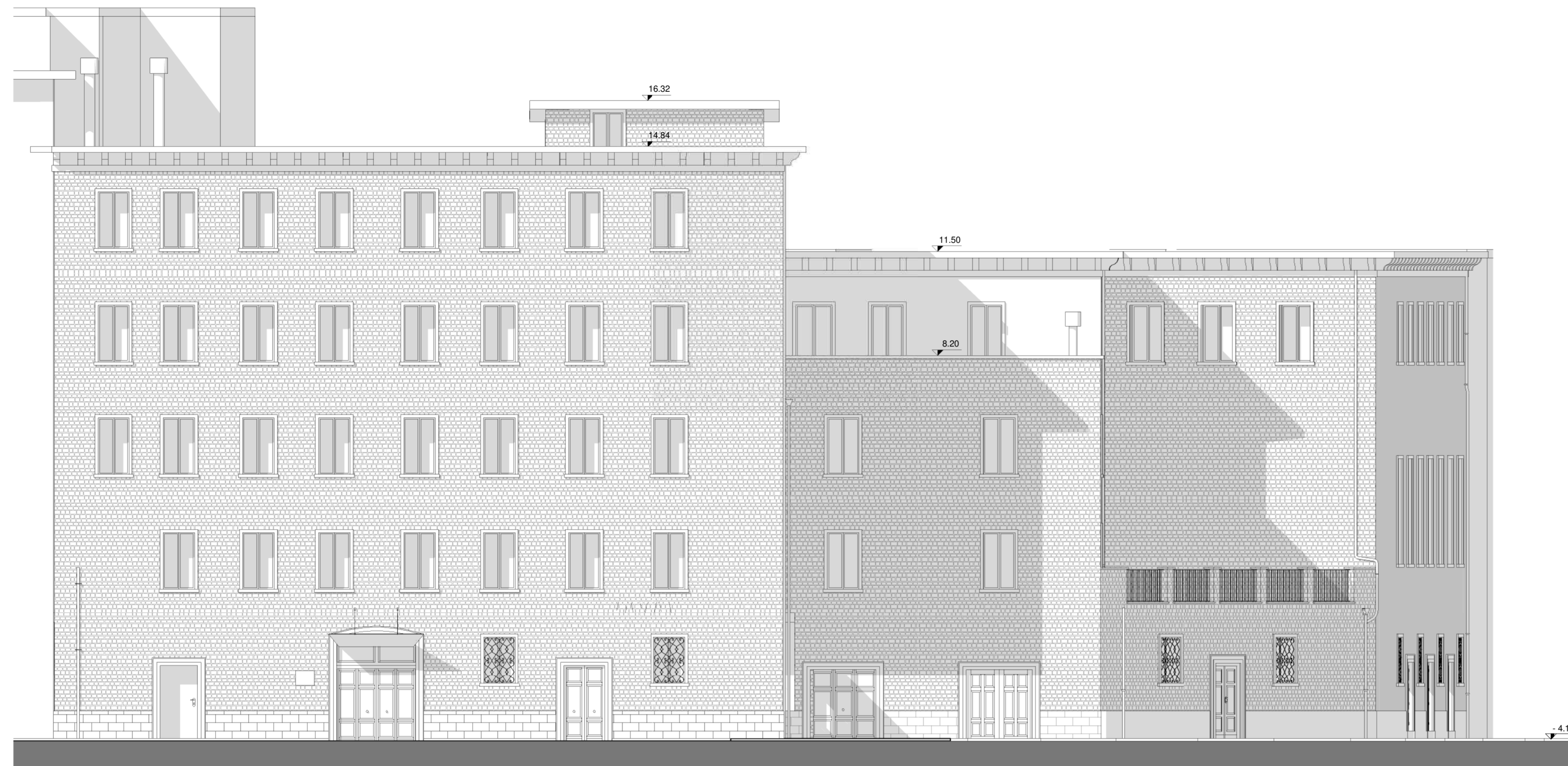
Prospetto Nord-Est (1:100)