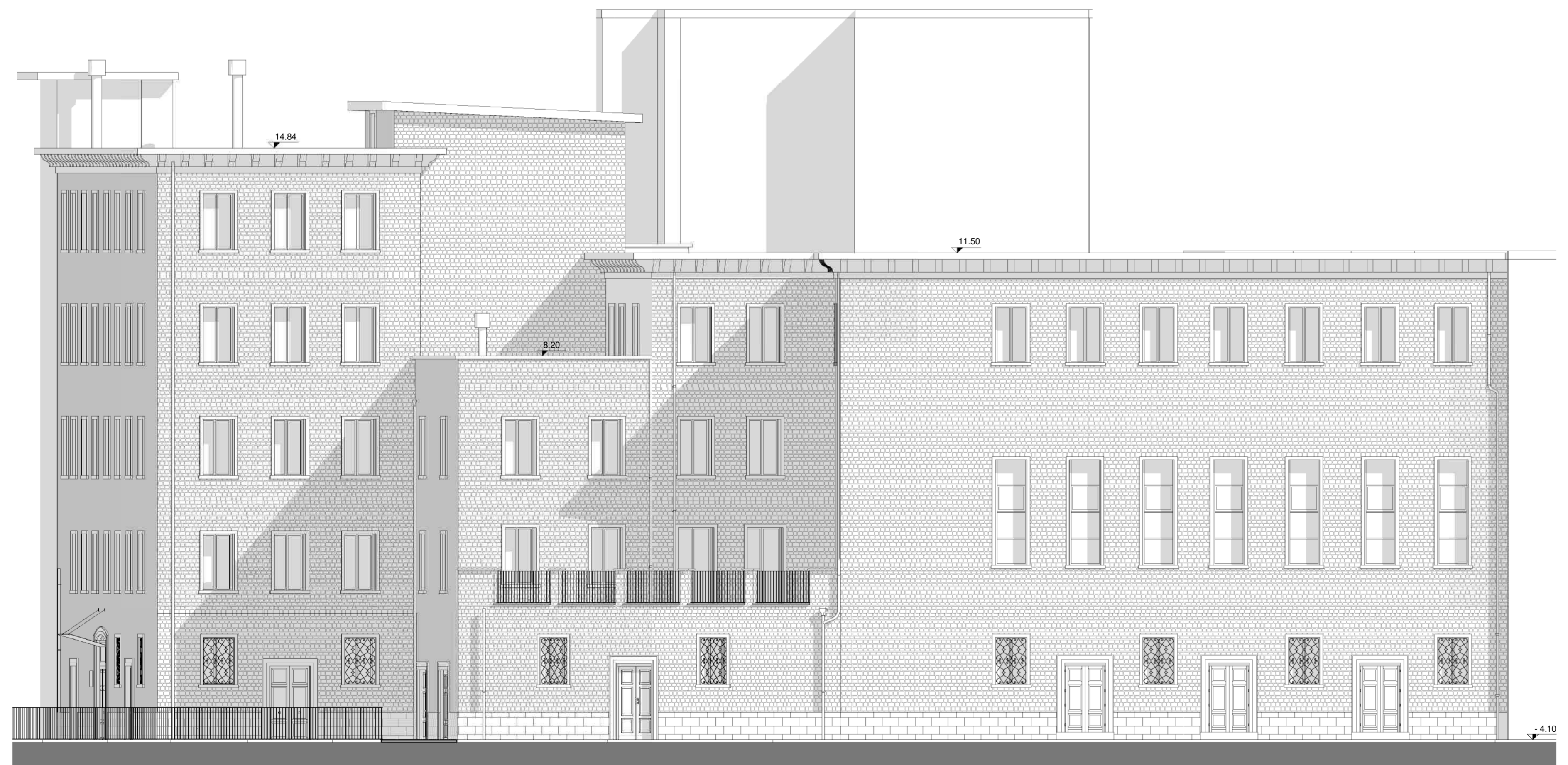
Prospetto Nord-Ovest (1:100)