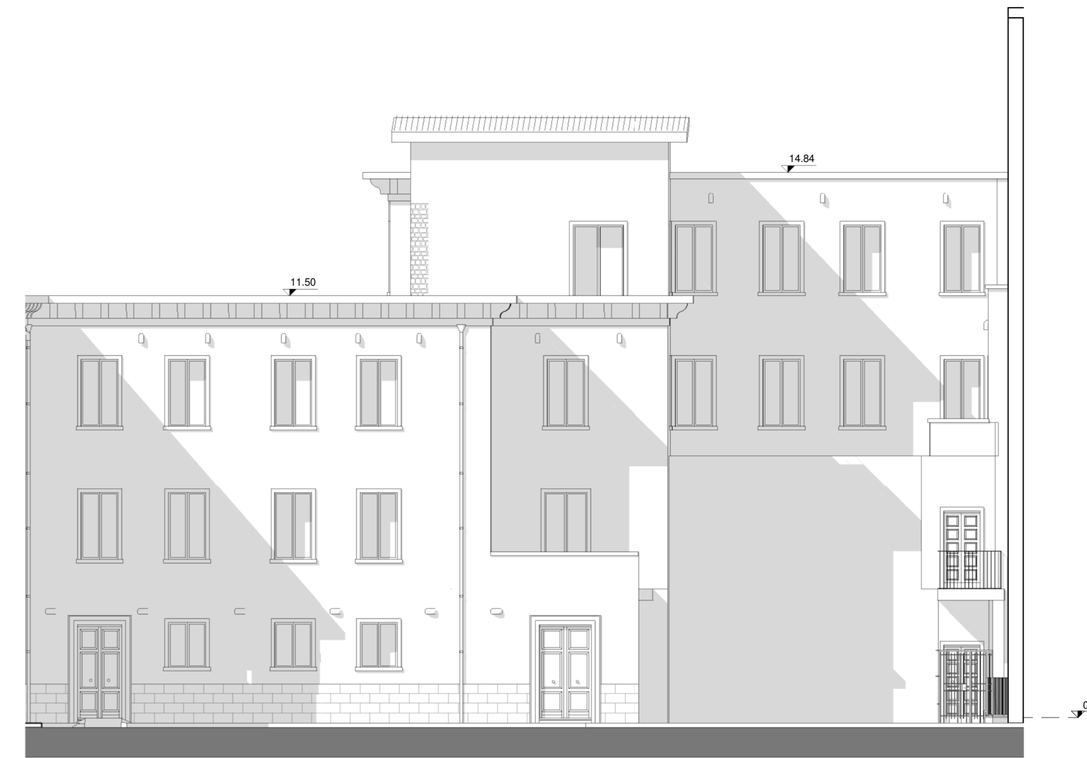
Prospetto Sud-Ovest (1:100)